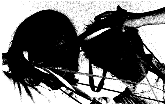
Hra s barevnými pruhy látek