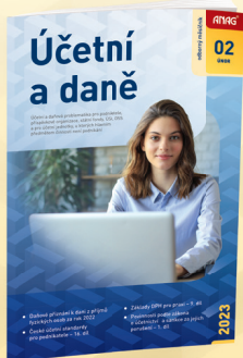
MĚSÍČNÍK ÚČETNÍ A DANĚ