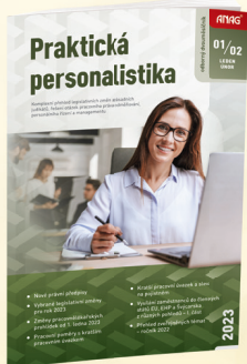
DYOMĚSÍČNÍK PRAKTICKÁ PERSONALISTIKA