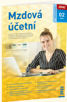
MĚSÍČNÍK MZDOVÁ ÚČETNÍ