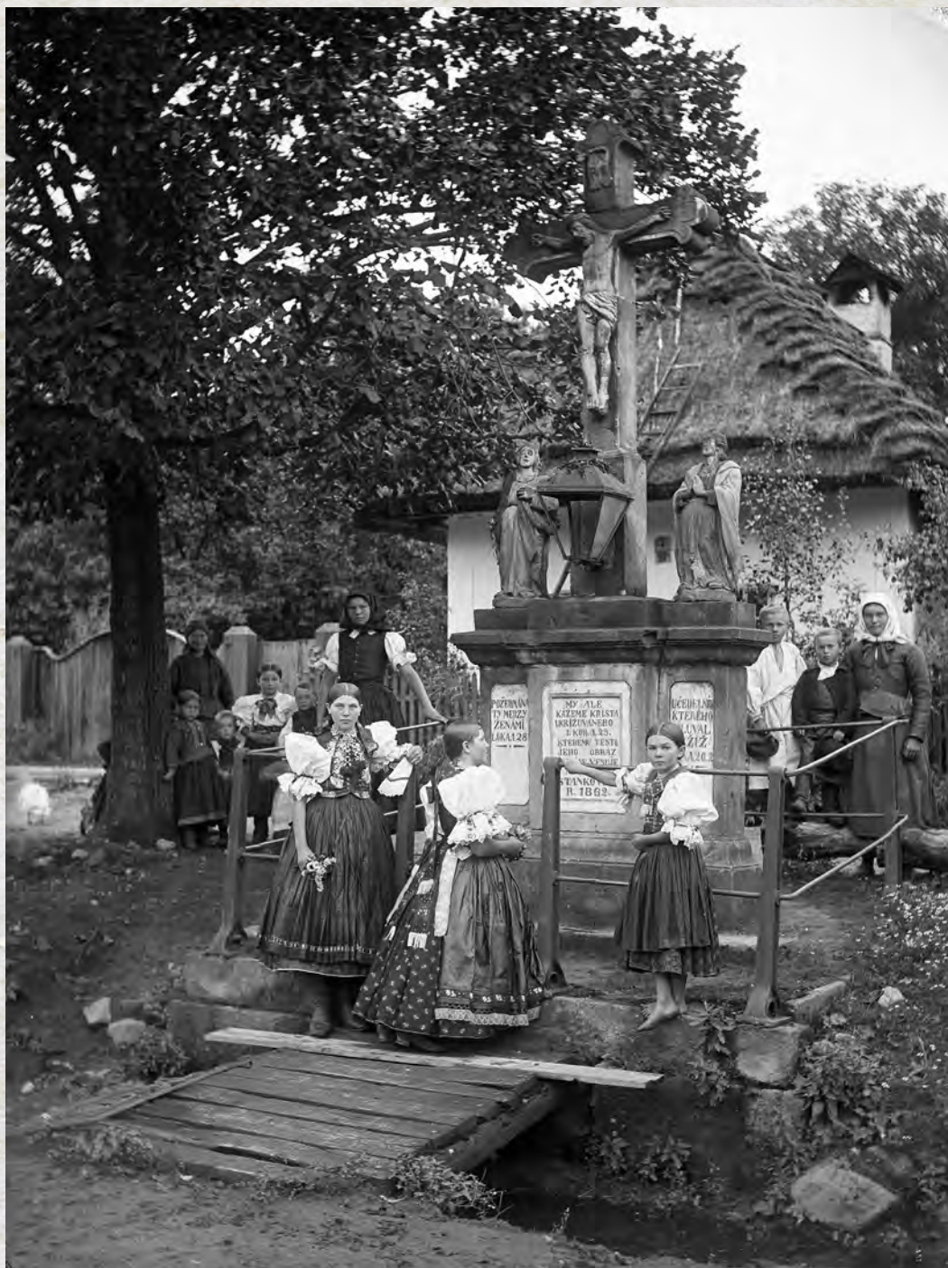
✓ Skupina dievčat a žien poniže fary Andreja Kmeťa