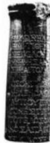
SEKILOVA PÍSEŇ, DÁNSKE NÁRODNÉ MÚZEUM, KODANĚ