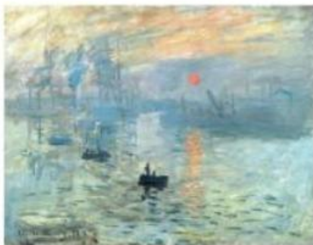
CLAUDE MONET: IMPRESSION, SOLEIL LEVANT

Názov impresionizmus vznikol podľa obrazu francúzskeho maliara Claude Moneta (1840–1926) „Impression, soleil levant“ (Dojem, východ slnka), ktorý bol vystavený v roku 1874 na výstave nezávislých maliarov v Paríži. Jemná farebná neurčitosť obrazu zachytáva jedinečný okamih rána v severofrancúzskom prístave Le Havre. Na obraze vidíme more a nad ním východ slnka, ktorý sa odráža na vodnej hladine. V pozadí sa objavujú sťažne obchodných lodí. Snahou maliarov impresionistov bolo zachytiť okamžitú a neopakovateľnú atmosféru danej chvíle. Obrazy sú tvorené krátkymi ťahmi (resp. dotykmi) štetcom, s nemiešanou farbou.