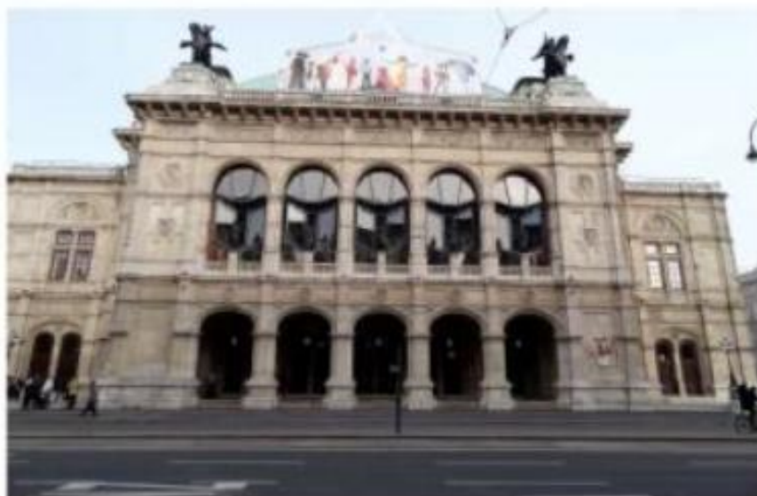
VIEDENSKÁ ŠTÁTNA OPERA

Jedno z najkrajších divadiel v Európe sa nachádza vo Viedni. Budova Viedenskej štátnej opery (nemecky Staatsoper Wien/Wiener Staatsoper) bola slávnostne otvorená 25. mája 1869 predstavením Mozartovej opery Don Giovanni. Pôsobili tu skladatelia Gustav Mahler a Richard Strauss. Na konci druhej svetovej vojny bolo divadlo zničené a o desať rokov neskôr po rozsiahlej rekonštrukcii znovu otvorené. Počas sezóny býva v divadle uvedených viac ako dvesto predstavení, pričom hlavný repertoár tvoria operné a baletné diela. Každoročne usporiadaný Ples v opere je jednou z najväčších kultúrnych udalostí Európy.