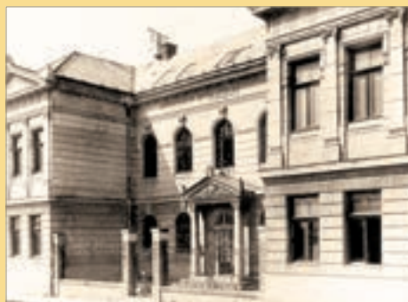
Budova Slovenského národného múzea v Martine v roku 1908

za ich odpor proti maďarským bohoslužbám.