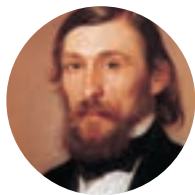
Jozef Miloslav Hurban (výrez z olejomalby Johanna Bössa)