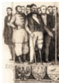
Účastníci Slovanského zjazdu v júni 1848 v Prahe (kresba J. V. Hellicha)