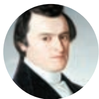
Michal Miloslav Hodža (výrez z olejomalby Jozefa Božetecha Klemensa)

to, čo dnes niektorí politici účelovo stavajú proti sebe, jedno pred druhým nadradujú a glorifikujú. Dielo tejto skvelej generácie sa napokon zavŕšilo v ucelenom štmásťbodovom slovenskom programe Žiadosti slovenského národa prijatom 10. – 11. mája 1848 v Liptovskom Svätom Mikuláši-On-drašovej. Okrem iného obsahoval požiadavky: vytvorenie spoločného snemu pre všetky národy Uhorska, vlastných národných snemov, vytýčenie etnických hraníc územia osídleného Slovákmi, používanie slovenčiny na území Slovenska ako národnej reči, vyučovanie na školách po slovensky, vybudovanie národného školstva od ľudového až po univerzitu, právo používať národnú zástavu, ustanovenie slovenských veliteľov v národnej garde a zavedenie slovenského velenia, uznanie práva vydávať slovenské noviny, práva zakladať spolky a zhromažďovať sa. Bola v nich deklarovaná aj potreba bratského spolunažívania a kategoricky sa odmietla idea jednotného uhorského (rozumej maďarského, pozn. autora) národa, národná nadradenosť a útlak. Za priekopnícku môžeme považovať požiadavku prebudovať Uhorsko na federatívny štát. Odmietnutie Žiadostí maďarskou vládou a snemom bolo dôkazom, že Maďari sa nemienili vzdať odnárrodnovacej politiky a pretvorenia mnohonárodného Uhorska na národný štát Maďarov – Veľkého Maďarska strednej Európy. Zákonodarstvo maďarskej revolúcie týmto prejavilo tragickú obmedzenosť, najmä čo sa týka riešenia národnostnej otázky. Žiaľ, práve v týchto cieľoch maďarstvo „skryto“ nepoľavilo do dnešných čias.