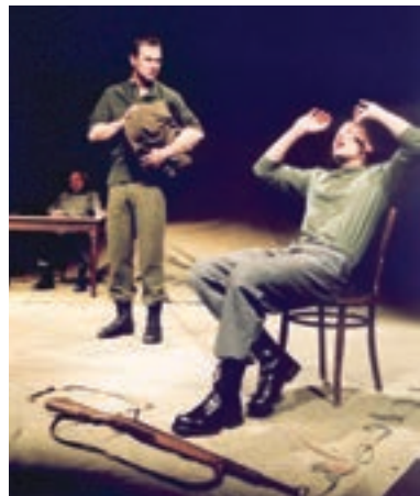
Rozhovor s nepriateľom (SND, 2004)

Lahola. Jeho tvorbu poznamenali dehumanizujúce vplyvy vojny. Po vojne emigroval do Izraela, kde sa uplatnil najmä ako režisér. († 12. 1. 1968)