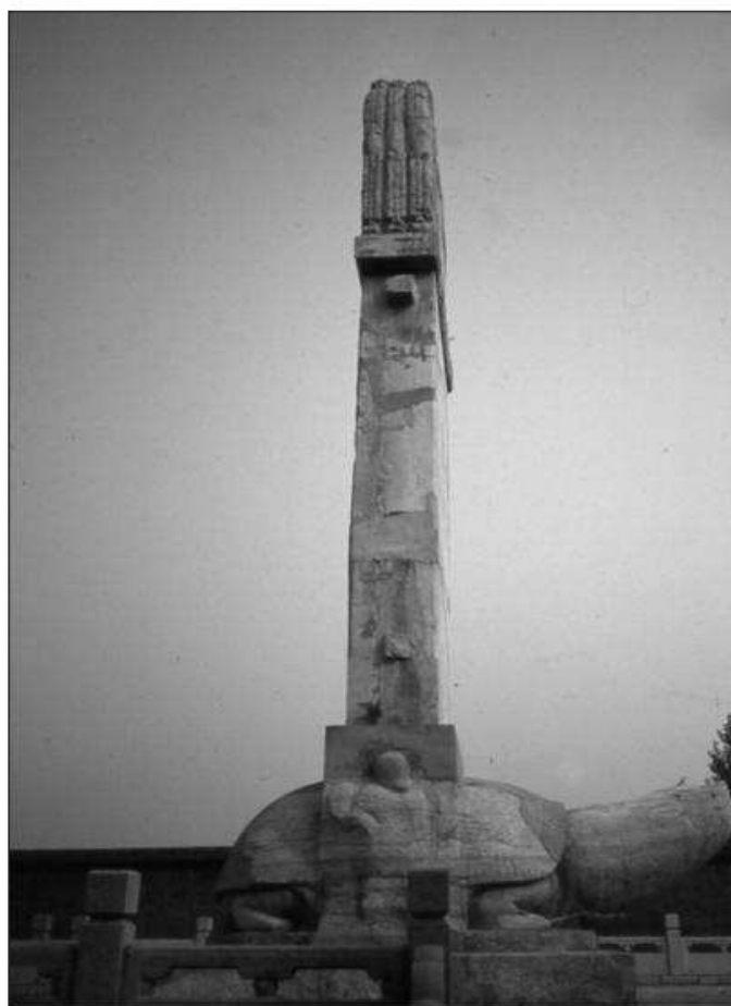
Obr. 1: U „místa narození Žlutého císaře“ Chuang-tiho.

V mytických časech, dávno před první historicky ověřenou dynastií, vládli v „Říši středu“ takzvaní legendární císařové. Bylo jejich celkem pět a doba jejich vlády sahá od 5. do 3. tisíciletí př. n. l. Prvním z nich byl „Žlutý císař“ Chuang-ti – nelze zaměňovat s pozdějším císařem dynastie Čchin Š-chuang-tim (259–210 př. n. l.), jehož pohřební pyramidu na východ od města Si-anu střeží obrovská hliněná armáda. Po prvním bájném císaři následovali jeho syn Šao-chao a další vládcí Jen-ti, Sia-nung-ti a Cch'-jou-ti. Co o těchto záhadných legendárních císařích vypráví dávná tradice?