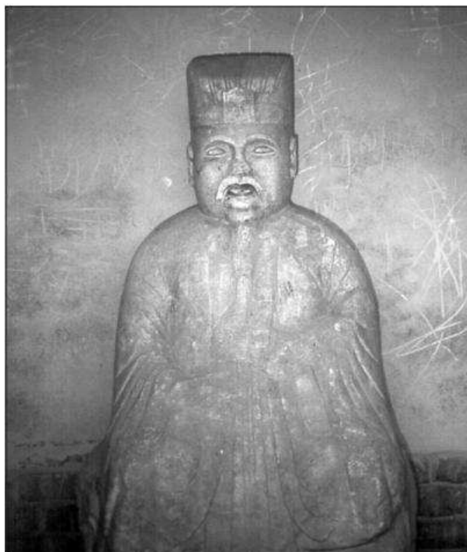
Obr. 2: Socha bájného císaře Šao-chaa. Byl potomkem mimozemských „bohů“?

vysoká, obložená žulovými kvádry a je pokládána za pohřební pyramidu druhého bájného císaře, Šao-cha. Ten ve 4. tisíciletí př. n. l. nastoupil po svém otci Chuang-tim. Na rozdíl od něho se však nevrátil zpátky na nebe, ale zemřel na Zemi a byl nejprve pochován v prostém a nezpevněném mohylovém hrobě.