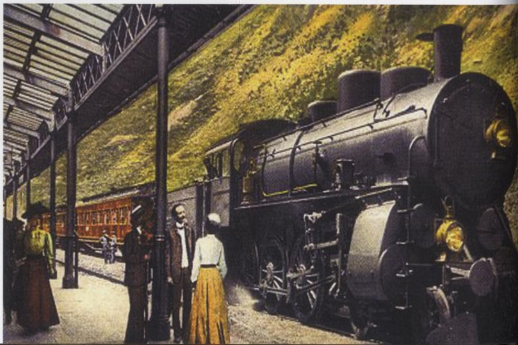
Železniční stanice Göschenen na Gotthardské dráze, Švýcarsko, 1910 (vpravo) Holandský plakát pro Amsterdam–Marseille Riviera Express, 1901 (protější strana)