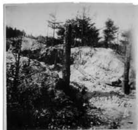
Místo upálení - ohavné kůly lesní boudy