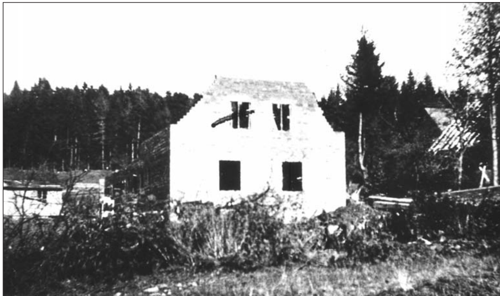
Dva snímky Ploštiny po devatenáctém dubnu 1945: z deseti venkovských stavení zbyly jen trosky.