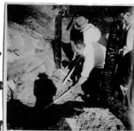
Němci z Ranošova vyhrabují pozůstatky obětí