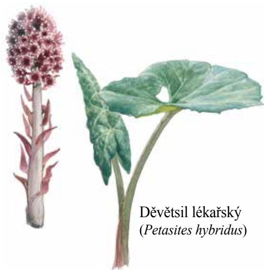
Děvětsil lékařský ( Petasites hybridus )