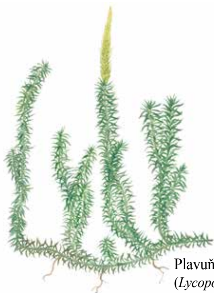
Plavuň vidlačka ( Lycopodium clavatum )