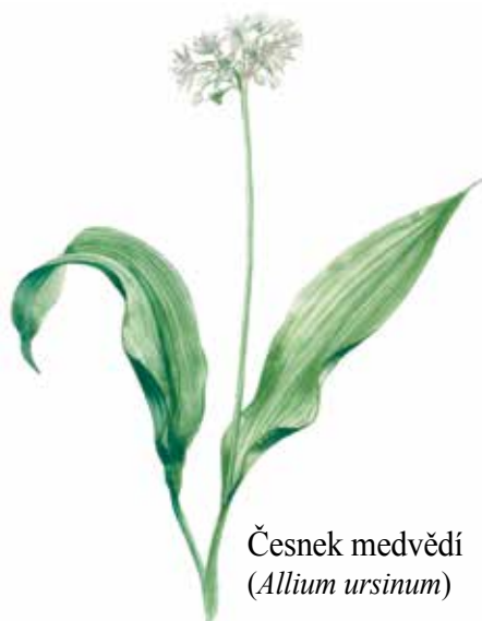
Česnek medvědí ( Allium ursinum )