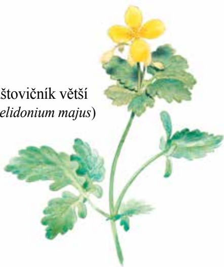
Vlaštovičník větší ( Chelidonium majus )