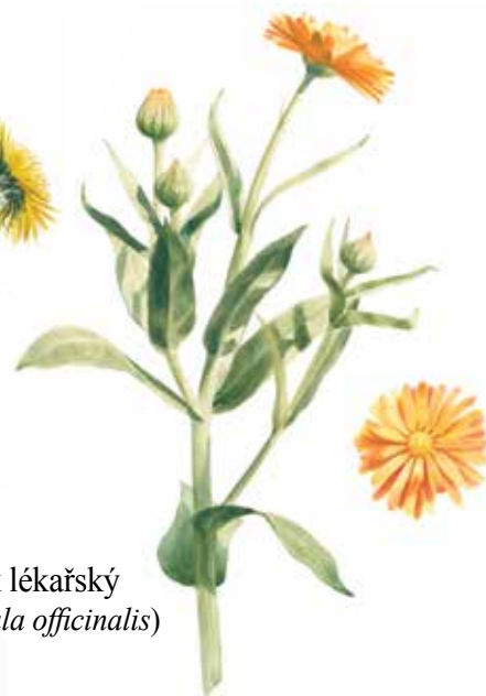
Měsíček lékařský ( Calendula officinalis )