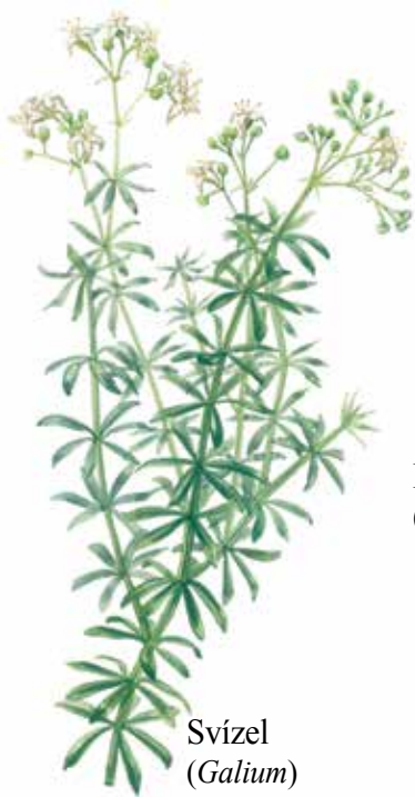
Svízel ( Galium )