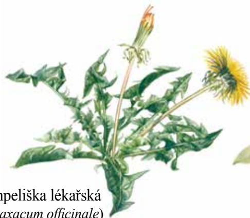
Pampeliška lékařská ( Taraxacum officinale )