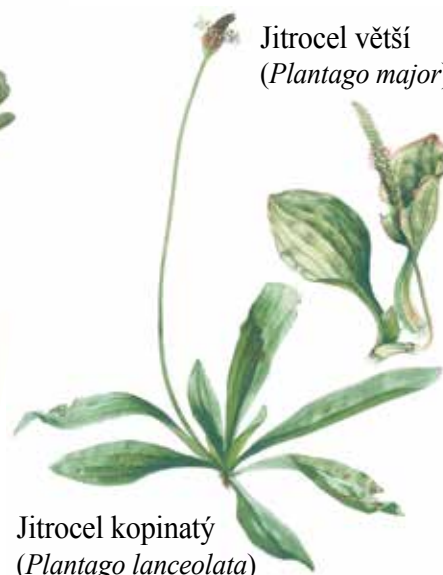
Jitrocel kopinatý ( Plantago lanceolata )