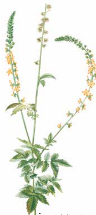
Řepík lékařský ( Agrimonia eupatoria )