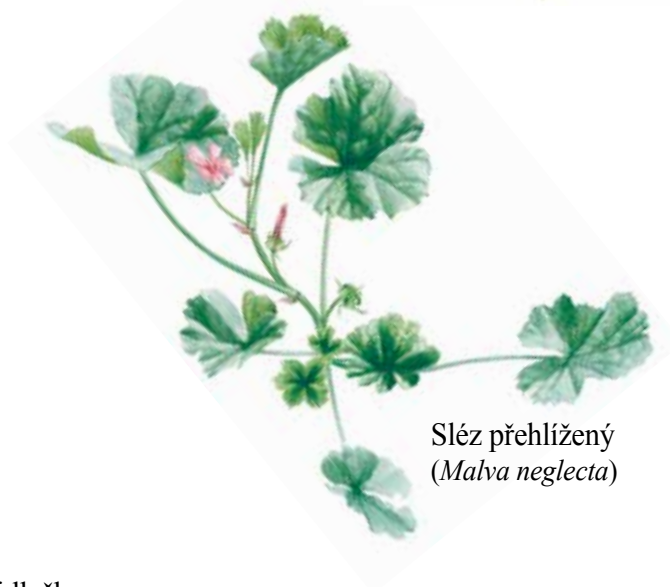
Sléz přehlížený ( Malva neglecta )