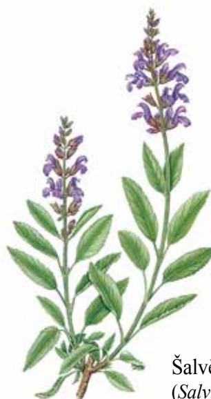
Šalvěj lékařská ( Salvia officinalis )