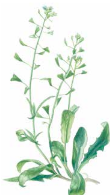
Kokoška pastuší tobolka ( Capsella bursa-pastoris )