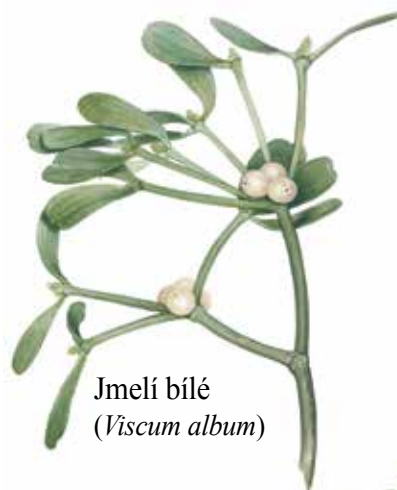
Jmelí bílé ( Viscum album )