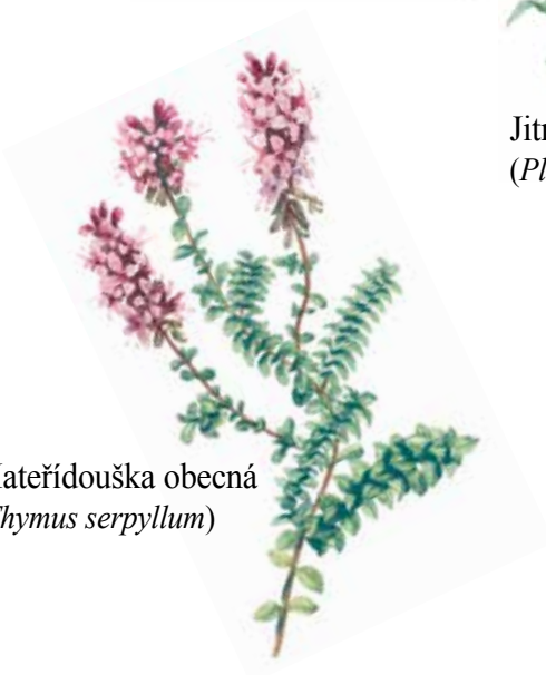
Mateřídouška obecná ( Thymus serpyllum )