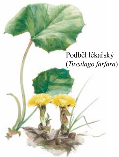
Podběl lékařský ( Tussilago farfara )