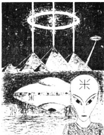
Obrázek 30: Chufuova, Rachefova a Menkaureova pyramida při práci